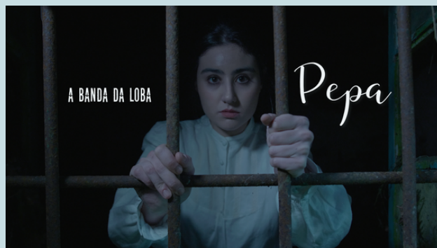
Xabón Lagarta (2022)