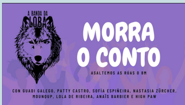
Fábrica de luz (2019)