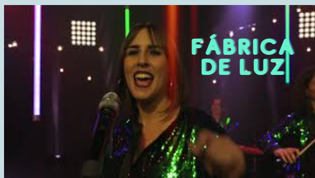
Fábrica de luz (2019)