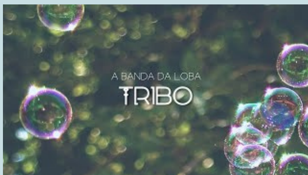
Xabón Lagarta (2022)