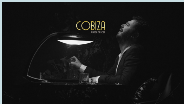
Xabón Lagarta (2022)