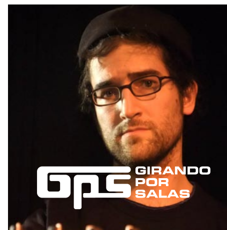
Logo calado en blanco sobre fotografía.