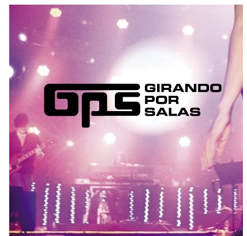
Logo en negro sobre fotografía en color con tonos demasiado cerca de la gama de tonos de la marca GPS.