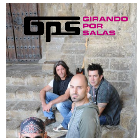
Logo en positivo sobre fondo con poca saturación de color.